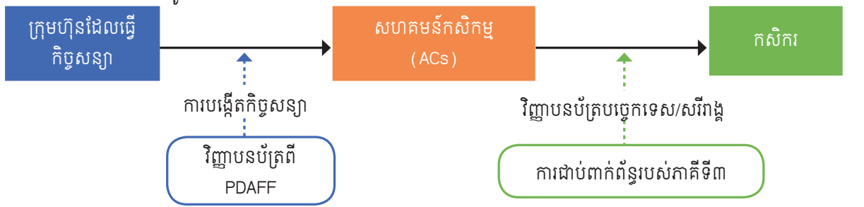
គំរូ CF មានស្រាប់ (ជាផ្លូវការ):